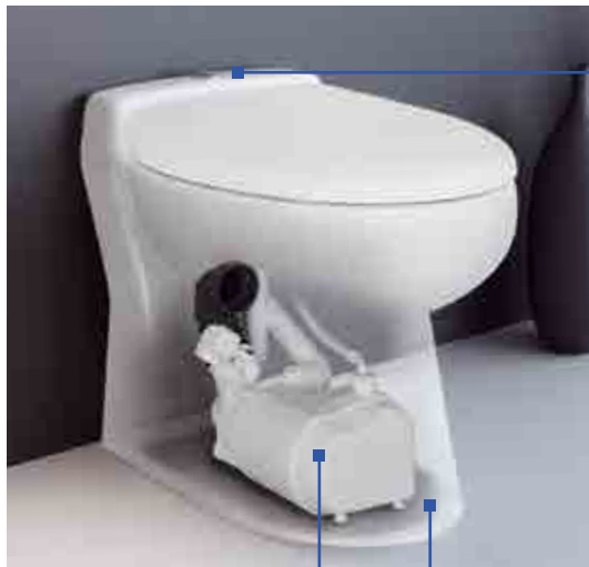
Système double touche économie d'eau 2/4 litres