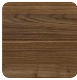
44H Cottage Noyer Fil horizontal*