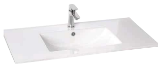
Plan-vasque en céramique blanc brillant