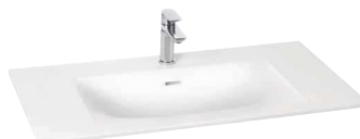
Plan-vasque en minéral solid blanc mat