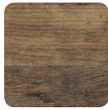
46H Chêne Vintage Fil horizontal*