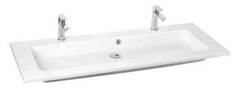
Plan-vasque en composite blanc brillant