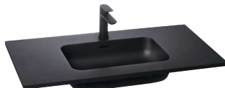
Plan-vasque en pierre compacte noire