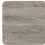
54H Origine Chêne gris Fil horizontal*