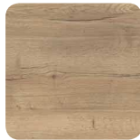
53H Origine Chêne brut Fil horizontal*