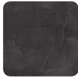
56H Ardoise Métal Fil horizontal*