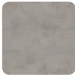
52H Effet Béton Fil horizontal*