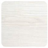
72 Sciée Blanc Fil horizontal