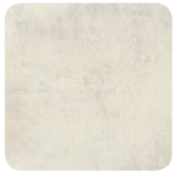
55H Béton Blanc Fil horizontal*